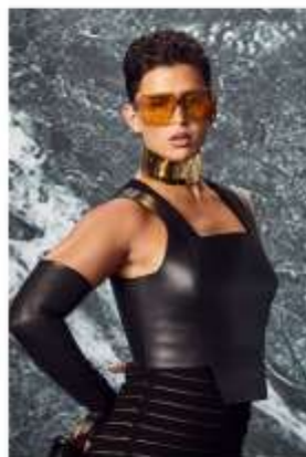
NATHY PELUSO "GENDARME" frame