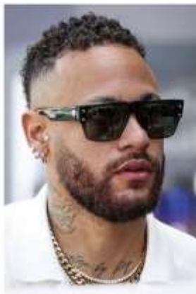
NEYMAR "B-II" frame