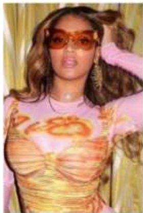
BEYONCE "ARMOUR" frame