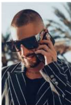
MALUMA "WONDERBOY" frame