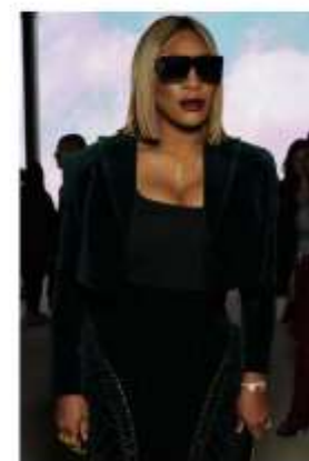
SERENA WILLIAMS "WONDERBOY" frame