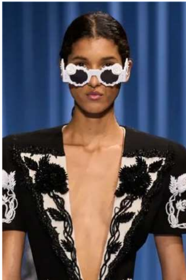
Balmain fashion show Woman SS24