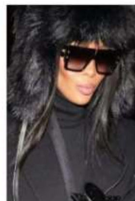
NAOMI CAMPBELL "B-GRAND" frame