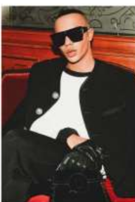
OLIVIER ROUSTEING "B-GRAND" frame