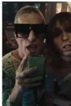
MANESKIN "B-GRAND" frame