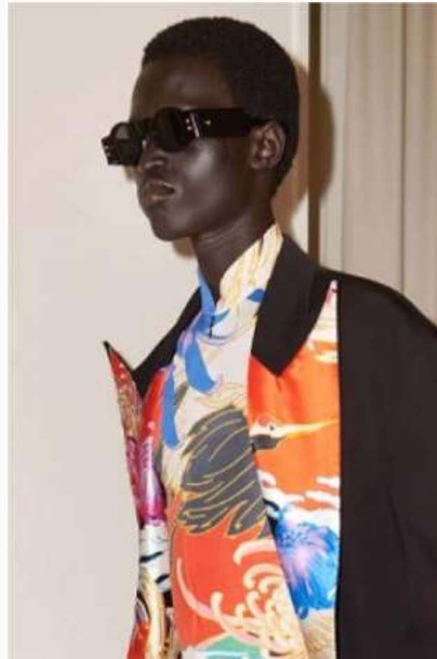
Balmain fashion show Man SS24