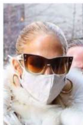
J-LO "B-II" frame