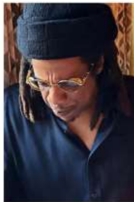
J-Z "BRIGADE I" frame