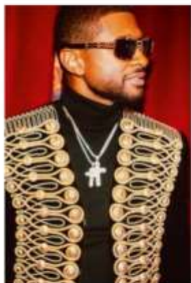
USHER "TITAN" frame