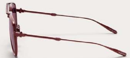
VLS-133F-59 Bordeaux w/ Bordeaux - AR