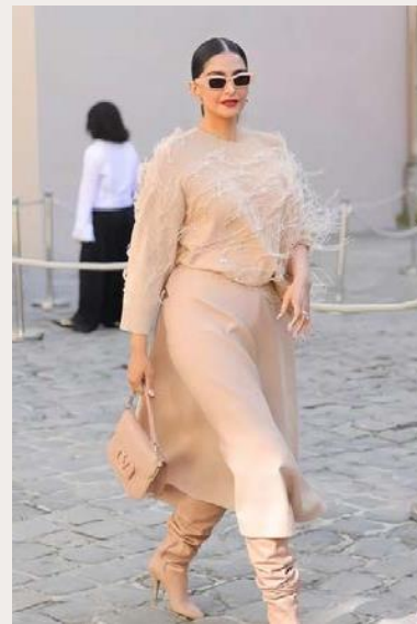
SONAM A KAPOOR