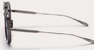
VLS-129B-50 Crystal Black - Brushed Black w/ Dark Grey - Black Flash Mirror - AR