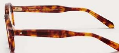
VLX-132B-46 VLX-132B-46-AF Black Swirl - Black Rhodium