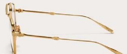
VLX-133B-59 Matte Black Rhodium