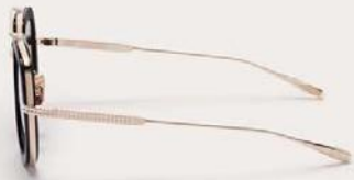
VLS-129A-50 Black - White Gold w/ Dark Grey - AR