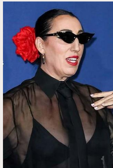
ROSSY DE PALMA