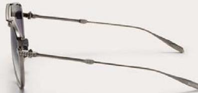
VLS-133E-59 Black Rhodium w/ Dark Grey to Light Grey - AR