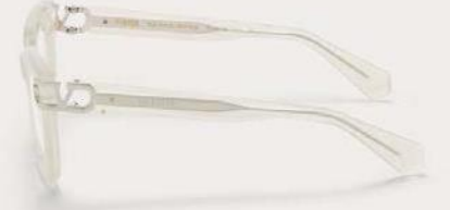
VLX-131A-51 Black Swirl - V Light Gold