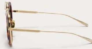
VLS-129C-50 Honey Tortoise - V Light Gold w/ Dark Green - AR