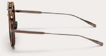
VLS-129D-50 Crystal Brown - Copper w/ Dark Brown - AR