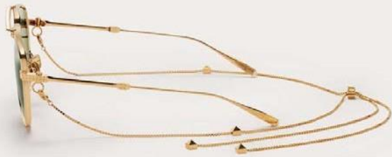
VLS-133A-59 VLS-133A-59-CH with chain V-Light Gold w/ Dark Green - AR