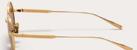
VLS-122A-52 White Gold w/ Dark Grey Lenses